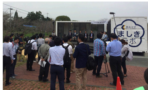
10月19日の開所式の風景

熊本大学は10月19日に秋津川河川公園に「ましきラボ」を開設しました。益城町の復興を住民の皆さんと学生・教員が語り合う場をめざしています。毎週土曜日午後2時から5時の時間帯は、熊本大学の教員と学生が常駐しています。ぜひお気軽にお越しください！