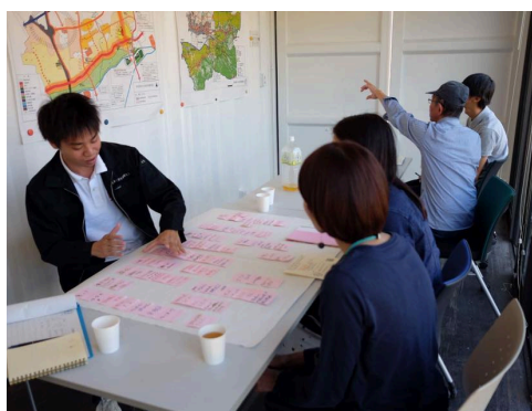
住民の皆さんとの語り合いの様子